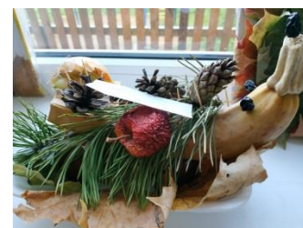
Фотографии с выставки поделок «Дары осени 2021». Работы победителей, 1-3 кл

Хочется сегодня поздравить не только мам, но и детей двумя стихотворениями. Первое стихотворение детское, а второе — философское о каждом из нас.