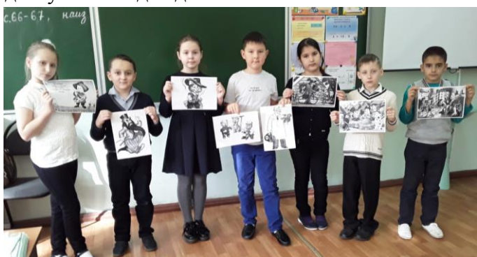
На фото – игра в начальной школе «Сказочные профессии»