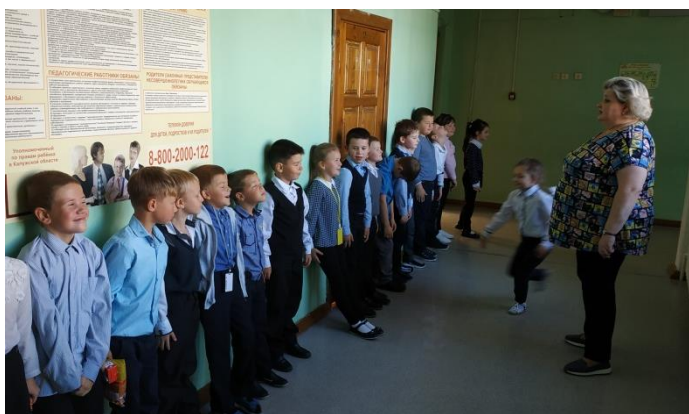
На фото учебная эвакуация 1А класса, Рисунок 10 кл.

В рамках Месячника гражданской обороны сотрудники Тарусской районной детской библиотеки им. Н.В. Богданова провели информационный урок для школьников «Твоя безопасность в твоих руках».