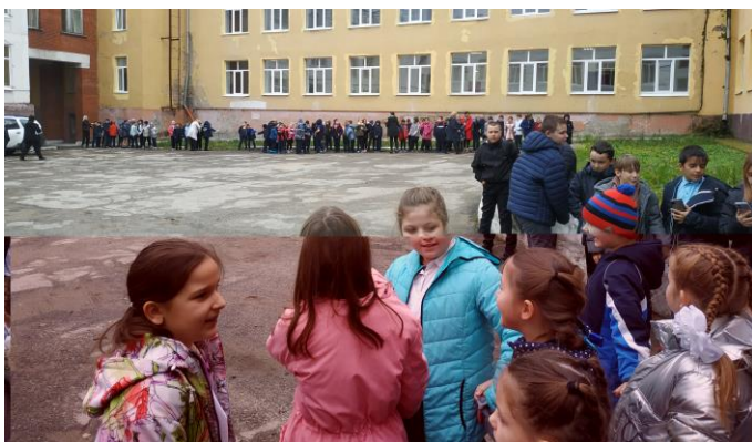
На фото учебная эвакуация классов

В рамках Месячника гражданской обороны сотрудники Тарусской районной детской библиотеки им. Н.В. Богданова провели информационный урок для школьников «Твоя безопасность в твоих руках».